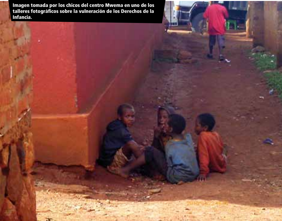
Imagen tomada por los chicos del centro Mwema en uno de los talleres fotográficos sobre la vulneración de los Derechos de la Infancia.

Causas estructurales: Rápido incremento poblacional, un mercado laboral escaso y un sistema educativo con pocos recursos.