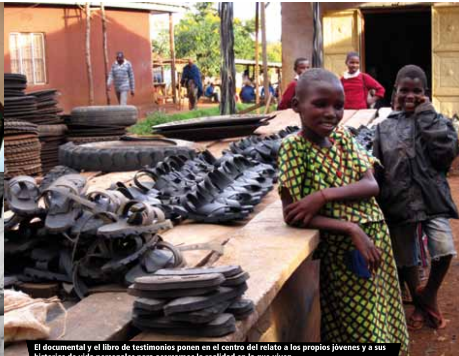
El documental y el libro de testimonios ponen en el centro del relato a los propios jóvenes y a sus historias de vida personales para acercarnos la realidad en la que viven.

Todos los participantes en el vídeo y en el libro de historias han conocido desde el comienzo el objetivo del proyecto 'Mwonekano Tofauti', sus contenidos y objetivos, otorgando su consentimiento informado y firmado para poder utilizar sus testimonios.